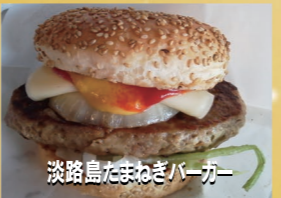
淡路島たまねぎバーガー

たくさんのケータリングカー出店! まだまだ、写真以外にメニューを揃えています 当日、メニューの変更もありますのでご了承ください。