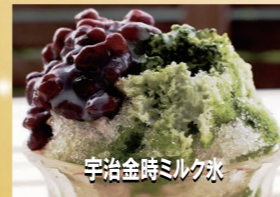
宇治金時ミルク氷