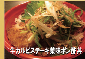
牛カルビステーキ薬味ポン酢丼