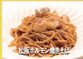
松阪ホルモン焼きそば